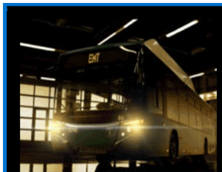
Y POR SUPUESTO, CONDUCTOR INCLUIDO