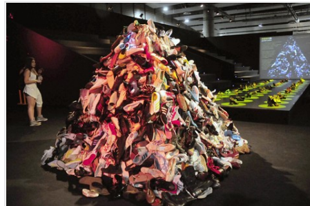
Presentación de MULAFEST